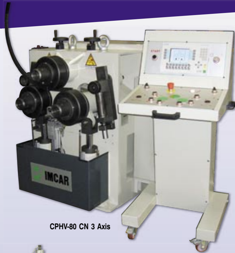
CPHV-80 CN 3 Axis