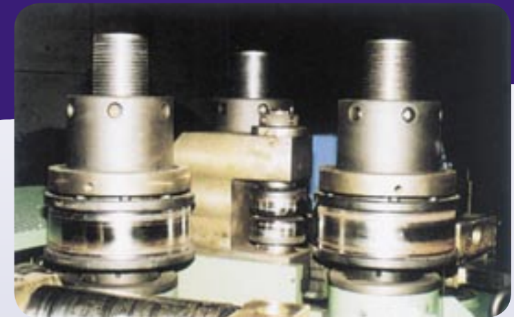
EQUIPMENT FOR PROFILE: IPE/INP/HE ON EDGE