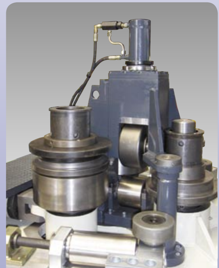
EQUIPMENT FOR PROFILE: UNP ON EDGE