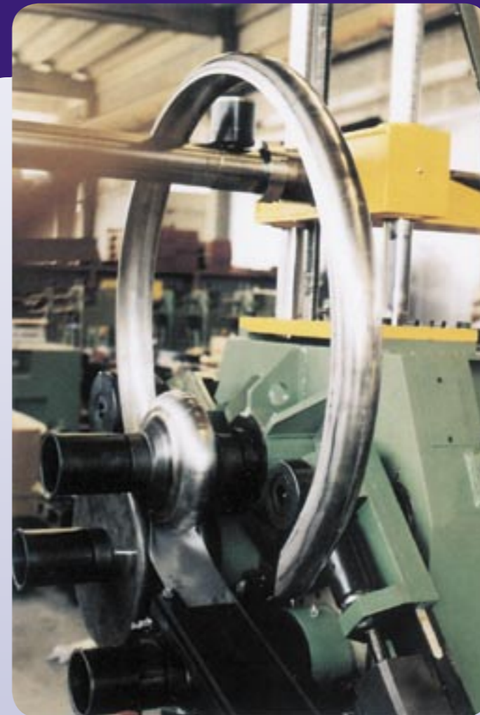
EQUIPMENT FOR HALF PIPES